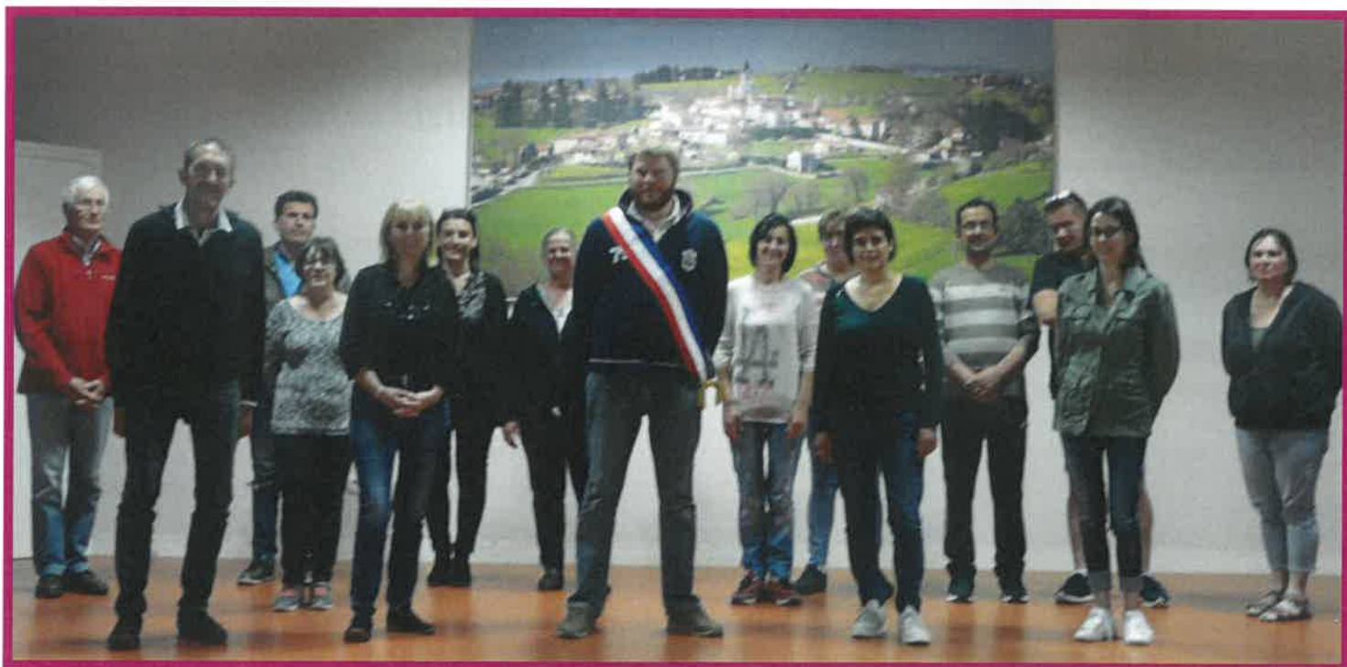
Nouveau conseil municipal