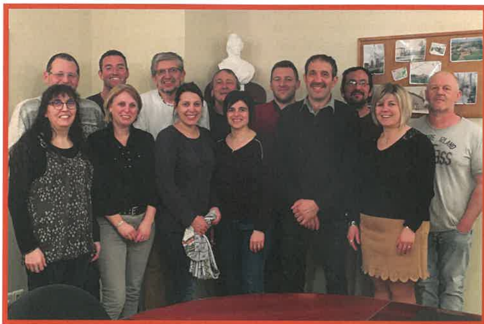
Ancien conseil municipal